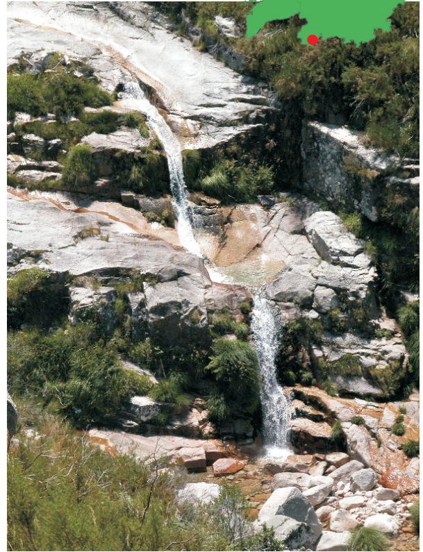
Un dos moitos saltos que podemos atopar no río Vilameá.