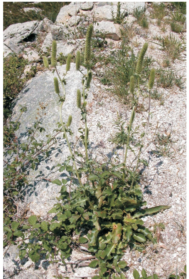
Cardo do Xurés ( Eringium duriaei subsp. juresianum ), especie endémica do Xurés.

Na serra do Xurés (Val de Vilameá) consérvanse formas traballadas polos glaciares cuaternarios máis occidentais de Europa: circos glaciares, morrenas, rochas estriadas, acumulacións de depósitos fluvioglaciais e vales en artesa.