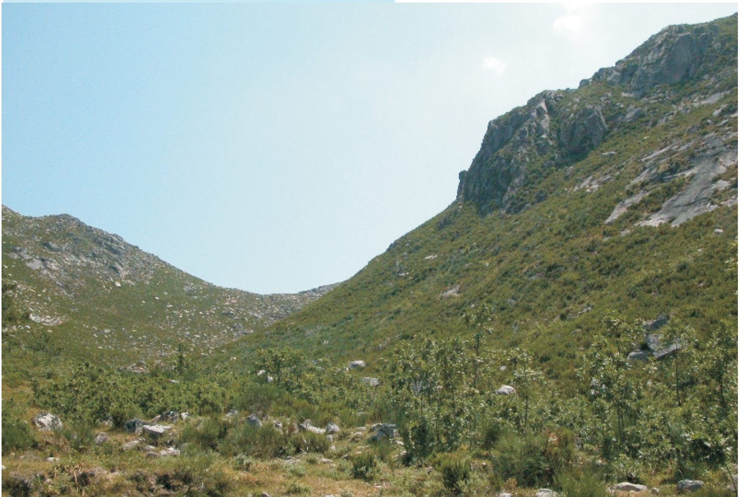
Parte alta do val glacial de Vilameá