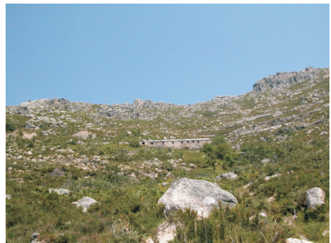
Mina das sombras

Non se aconsella facela en días de moita calor.