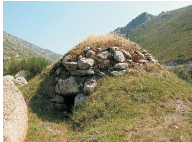
Chivana. Refuxio de pastores.

Unha ruta no parque Natural da BaixaLimia-Serra do Xurés de grande interese paisaxístico, xeolóxico, biolóxico e etnográfico. Poderemos coñecer o val glaciar do río Vilameá e os numerosos saltos e pozas que forma este río no seu brusco descenso desde os cumes da serra do Xurés ata atoparse co río Caldo (afluente do Limia).